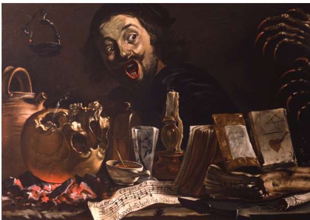
Pieter van Laer, Zelfportret met hekserij-attributen, ca. 1635 The Leiden Collection, New York

De tentoonstelling omvat ruim honderd kunstwerken die inzicht geven in het leven en de kunstenaarspraktijk van de Bentvueghels. Naast voorstellingen van hun feesten en ontgroeningsrituelen, zijn er werken van de Bentbroeders zelf te zien. Buiten tekenen was belangrijk voor de kunstenaars. Zij tekenden bouw- en beeldhouwwerken van de Klassieke Oudheid na, maar er zijn ook veel stadsgezichten en landschapstekeningen bewaard gebleven. In de expositie zijn prachtige italianiserende landschappen te zien, van onder anderen Jan Both, Cornelis van Poelenburch en Jan Baptist Weenix.