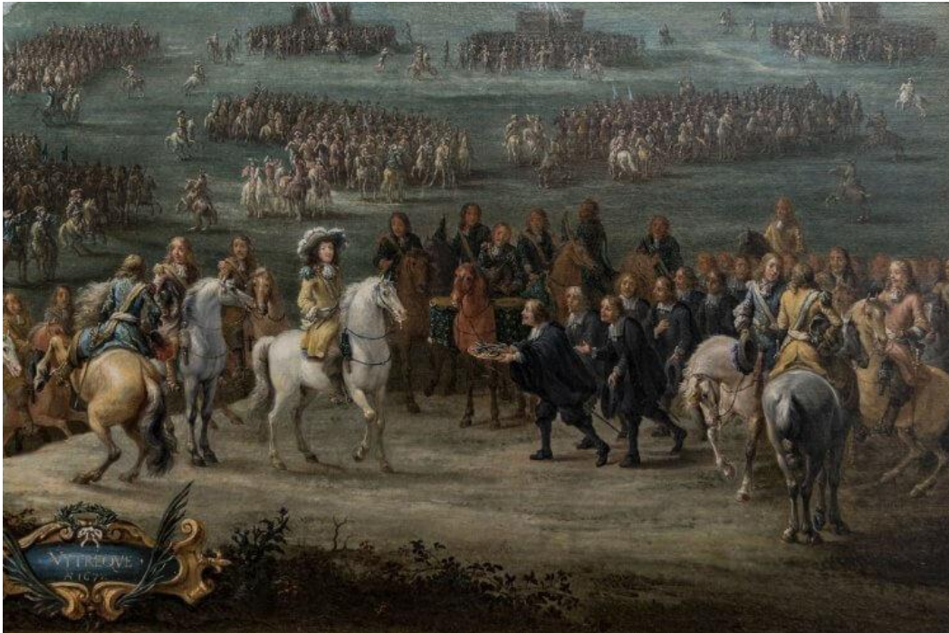
Lambert de Hondt II, De overgave van Utrecht in 1672 (detail) , Centraal Museum Utrecht.

Vanaf 1304 was de bewaking van de stad in handen van de 21 gilden; de tentoonstelling toont onder meer gildezegels van deze beroepsverenigingen van handelaren en ambachtslieden waar vrijwel iedere Utrechter verplicht lid van was. Ze waren verantwoordelijk voor de bewaking en het onderhoud van de hun toegewezen gildeslag. Ook zijn er wapenrustingen te zien van deze middeleeuwse burgersoldaten en een hoorn waarmee de nachtwakers elkaar konden waarschuwen bij onraad. En om een idee te krijgen van wat de gildeleden hadden te bewaken, zijn er nauwkeurige 3D-reconstructies gemaakt van de ommuring in de late middeleeuwen.