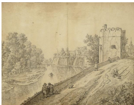
Links: Pieter Jan van Liender, Gezicht op de stadswal van Utrecht met rechts het bastion Zonnenburg, 1758. Particuliere collectie.