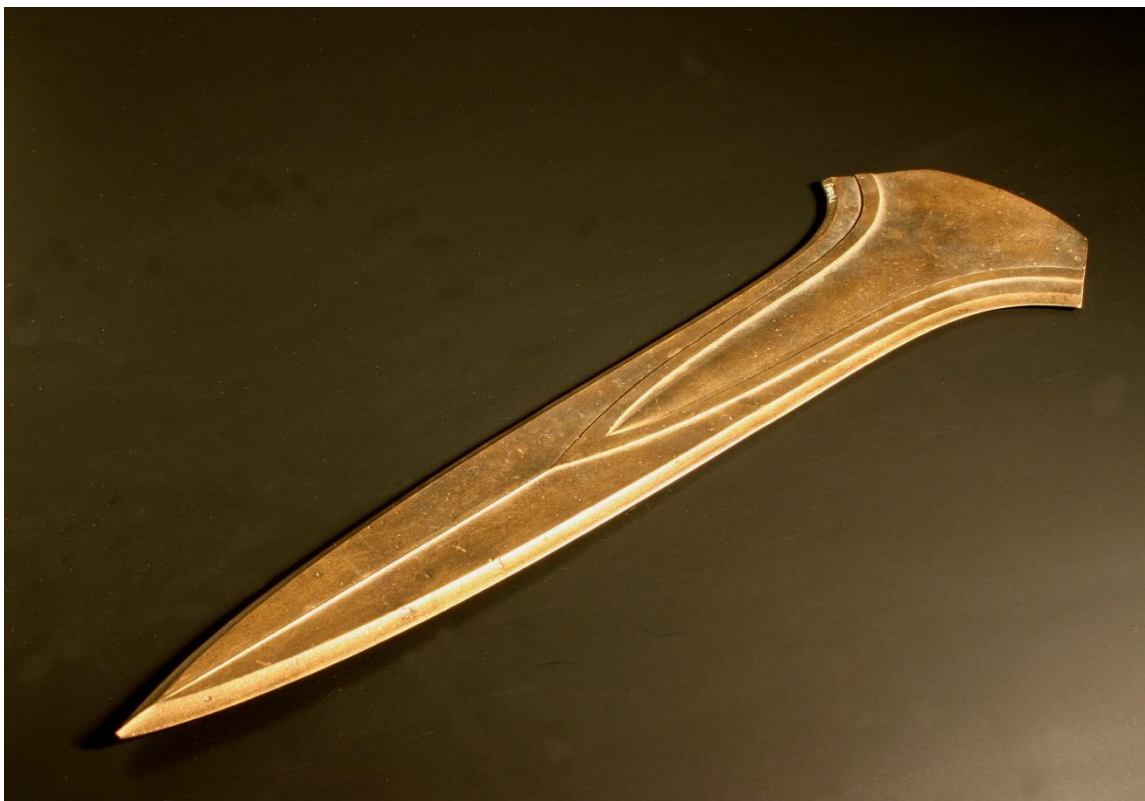
Zwaard van Jutphaas

zwaard. Als eerste, echte gevechtswapen staat het bronstijdzwaard daarom in de tentoonstelling symbool voor het begin van de wapenwedloop. Maar ook meer ceremoniële wapens uit de prehistorie worden getoond, waaronder het beroemde zwaard van Jutphaas dat in 1947 bij Utrecht is gevonden. Dit zeer kostbare zwaard, waarvan maar zes vergelijkbare exemplaren bekend zijn, vertelt veel over de betekenis van strijd en strijders in de toenmalige samenleving. Daarnaast zijn er Romeinse en vroegmiddeleeuwse wapens te zien, waaronder een recent gevonden strijdbijl uit de 9de eeuw.